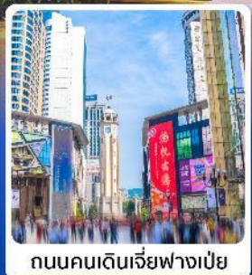
ถนนคนเดินเจี่ยฟางเป่ย์