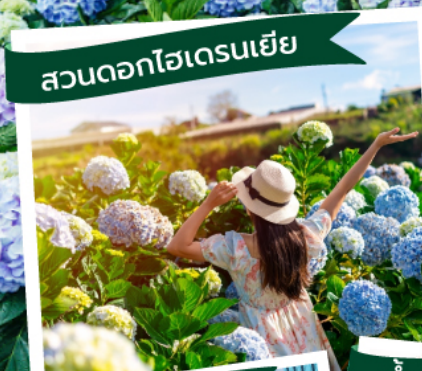
สวนดอกไฮเดรนเยีย