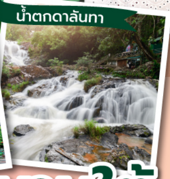
น้ำตกดาลันทา