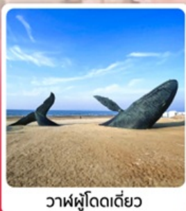
วาฬผู้โดดเดี่ยว