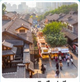
ถนนคนเดินสี่ปาตี