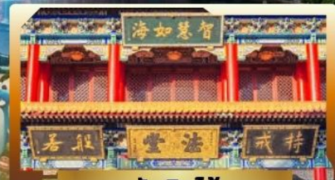
วัดจินไ้