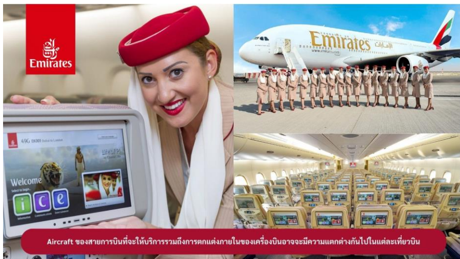
Aircraft ของสายการบินที่จะให้บริการรวมถึงการตกแต่งภายในของเครื่องบินอาจมีความแตกต่างกันไปในแต่ละเที่ยวบิน