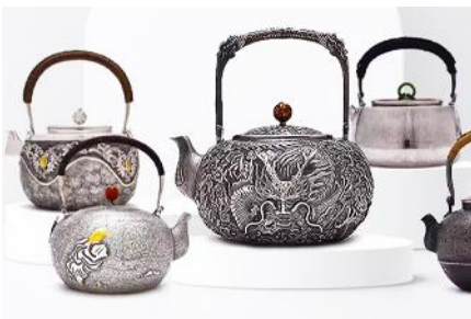
พิพิธภัณฑ์เครื่องเงินมองโกล