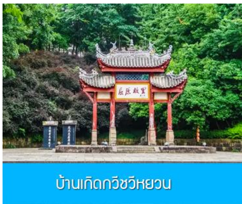
บ้านเกิดกวีวีหฺยวน

พักที่ HONG QIAO HOTEL โรงแรมระดับ 4 ดาวหรือเทียบเท่าในเมืองหยีซัง