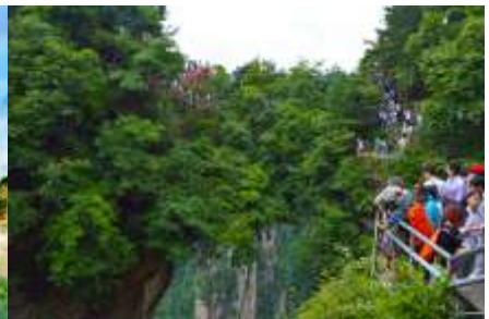
สะพานหนึ่งใบในไต้หล้า

วันที่หก จางเจียเจี๋ย-จีน-ลงลิฟท์แก้วเที่ยวเขาเทียนจื่อซาน-ภูเขาอวตาร-สะพานหนึ่งใบในไต้หล้า -ออฟชั่นะจก สะพานกรจกข้ามเขาแกรนด์แคนยอน