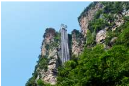
ลิงฟงเคี้ยวไปหลว

หลังอาหารนำท่านเดินทางเข้าที่พัก หรือท่านสามารถเลือกซื้อโปรแกรมเสริม เป็นบัตรชมการแสดง ชุด The Love Story of a Wooden man and Fairy fox หรือที่เรียกกันในหมู่นักท่องเที่ยวไทยว่า โชว์จิ้งจอกขาว เป็นการแสดงกลางแจ้งที่ทุ่มทุนสร้างอย่างสุดอลังการ เป็นการแสดงที่น่าดูชมที่สุดในเมืองจางเจียเจี๋ย การแสดงชุดนี้ใช้ภูเขาประติมากรรมเป็นฉากหลังประกอบการแสดง ซึ่งให้ความรู้สึกสมจริงเสมือนผู้ชมและนักแสดงอยู่ท่ามกลางธรรมชาติ ใช้ทีมงานนักแสดงหลายร้อยคน และระบบแสง สี เสียงที่ทันสมัยประกอบการแสดง อัตราค่าบริการสำหรับโปรแกรมเสริมการแสดงชุด The love Story of Wooden man and Fairy Fox ท่านละ 400 หยวน (หรือ 2,000 บาทขึ้นอยู่กับอัตราแลกเปลี่ยน) ระยะเวลาที่ใช้ในการเที่ยวชมการแสดง ประมาณ 3 ชั่วโมง รวมเวลาเดินทางไป กลับค่าบริการรวม ค่าบัตรเข้าชม ค่ารถรับ ส่ง และค่าน้ำดื่มของไกด์ท้องถิ่น พักที่ ZHENMIAN HOTEL โรงแรมระดับ 4 ดาวหรือเทียบเท่าจางเจียเจี๋ย