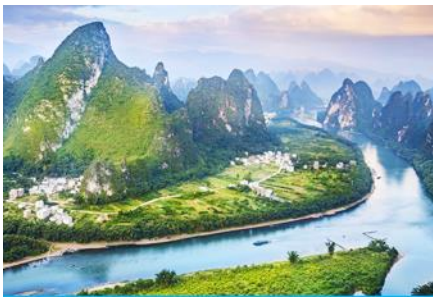
จุดชมวิวม่านน้ำหลีเจียงบนเขาเซียงกวง

พักที่ GUILIN VIENNA HOTEL ระดับ 4 ดาวท้องถิ่นหรือเทียบเท่าใน เมืองกุ้ยหลิน