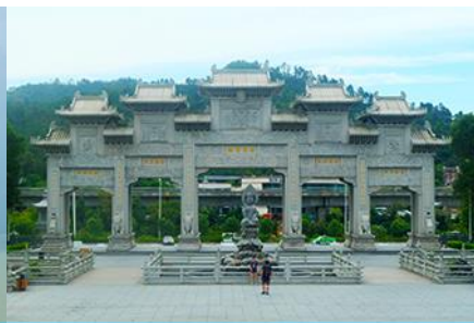
วัดฟูโกวซื่อ