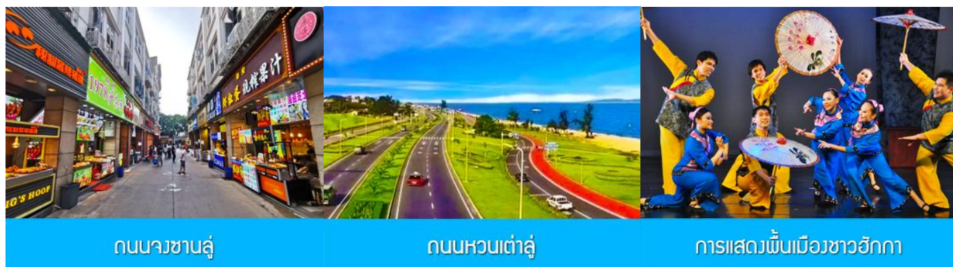
ถนนวซาลู่

พักที่ โรงแรม XIAMEN HENGLONG HOTEL 4* หรือเทียบเท่าในเมืองเซี่ยะเหมิน