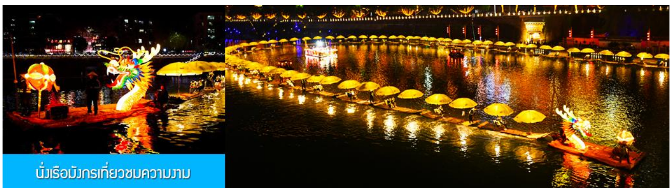
บัวเรือมังกรเที่ยวชมความงาม