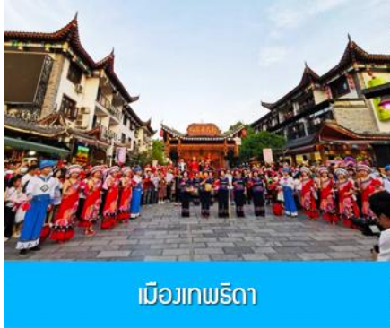
เมืองเกพริดา

หลังอาหารนำท่านเดินทางโดยรถบัสสู่ เมืองอินชือ 恩施 (ระยะทาง 236 กม. ใช้เวลาเดินทางราวผ่านถนนซูเปอร์ไฮเวย์ประมาณ 3 ชั่วโมง)