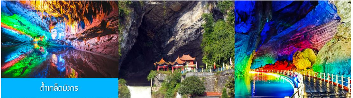
ถ้ำเกล็ดมังกร

พักที่ JINMA HOTEL ระดับ 4 ดาวท้องถิ่นหรือเทียบเท่าในเมืองเซียนเฉิน