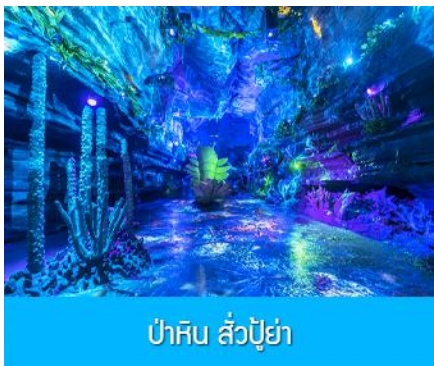
ป่าหิน ลั่วปู้ย่า

เที่ยง รับประทานอาหารกลางวัน ณ ภัตตาคาร (8)