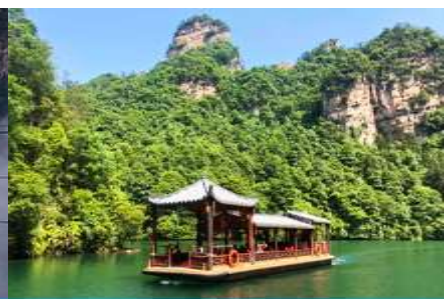
ล่องเรือทะเลสาบ เป่าเฟิงหู