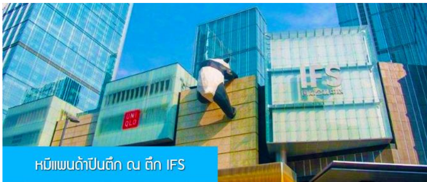
หมีแพนด้าปิ่นตึก ณ ตึก IFS

พักที่ DAGU GLACIER HOTEL 4* หรือ โรงแรมระดับเดียวกันพื้นเมือง