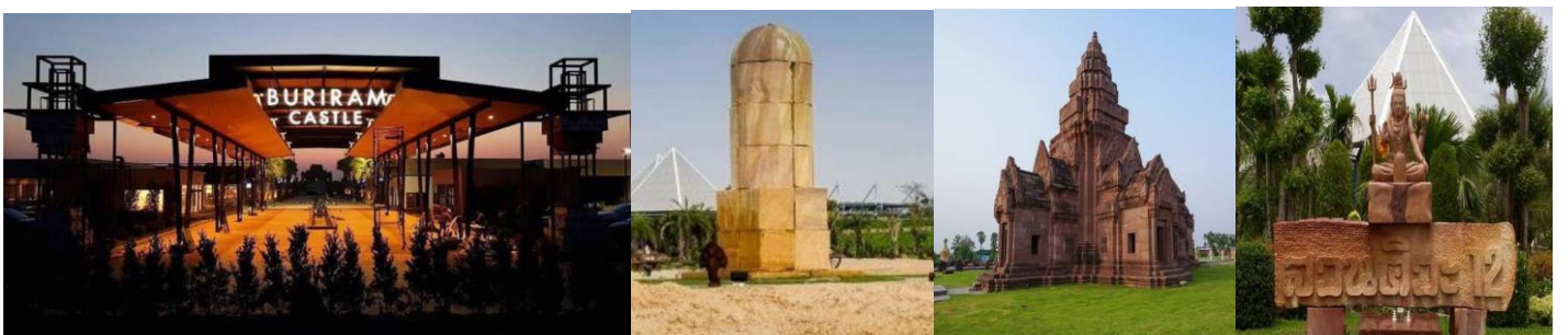
พักที่(N1) โรงแรม r2 (จ.บุรีรัมย์) หรือเทียบเท่า

18.00 น. รับประทานอาหารค่ำอิสระ ที่ BURIRAM CASTLE เป็นส่วนหนึ่งของ BURIRAM UNITED ตั้งอยู่ระหว่างสนาม Chang ARENA และสนามแข่งรถระดับโลก CHANG INTERNATIONAL CIRCUIT พื้นที่ขนาด 93,000 ตร.ม. แบ่งเป็น Avenue Area 35,000 ตร.ม. ,ปราสาทหินพนมรุ้งจำลอง 14,000 ตร.ม., สวนไม้ดอก ไม้ประดับ และสวนตะบองเพชร 35,000 ตร.ม. (ออกแบบและจัดสร้างโดย สวนนงนุช), CAR PARKING 8,000 ตร.ม. เป็นแหล่งอารยธรรมใหม่...ที่รวมหัวใจของบุรีรัมย์ไว้..ที่นี่ ที่เดียว ที่รวมความต้องการให้กับทุกคนได้ไม่ว่าจะเป็นชาวบุรีรัมย์ เพื่อนพี่น้องจากจังหวัดใกล้เคียง นักท่องเที่ยวทั้งไทยและต่างชาติ ที่นี่...ผसान โลก 2 ยุค ได้อย่างลงตัวที่สุด ความงดงามของอารยธรรมขอมในอดีต ผสานเป็นหนึ่งเดียวกับโลกไลฟ์สไตล์คนรุ่นใหม่ด้วย มาตรฐานที่เป็นสากล เปิดบริการ ปี 2558 (ต้นไตรมาส 3 ) มีปราสาทพนมรุ้งจำลอง เป็นจุด landmark และมีสวนหินและสวนตะบองเพชรขนาดใหญ่ ชม มหาศิวลึงค์ ที่ใหญ่ที่สุดในโลก “มหาศิวลึงค์” ตั้งอยู่ภายในสวน “สวนศิวะ 12” โดย มหาศิวลึงค์ ทำจากหินทราย สูงกว่า 9 เมตร ซึ่งใหญ่ที่สุดในโลก รายรอบด้วยแผ่นศิลาหินทราย “กามาสูต” ซึ่งเปรียบดั่งจุดกำเนิดแห่งจักรวาล