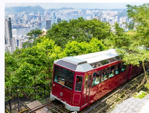
รถรางพิกแรม