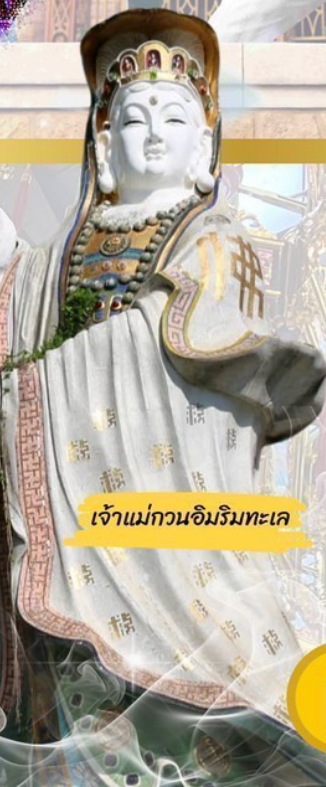
เจ้าแม่กวนอิมวิมทะเล