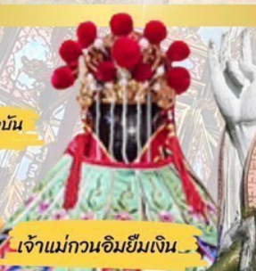
เจ้าแม่กวนอิมยืมเงิน