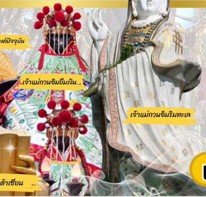
เจ้าแม่กวนอิมยืมเงิน