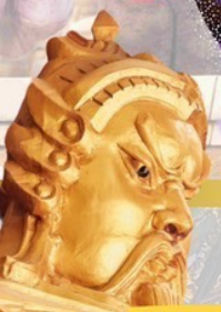
วัดแทงองค์ปัจจุบัน