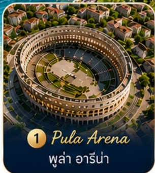
1 Pula Arena พูล่า อาร์น่า