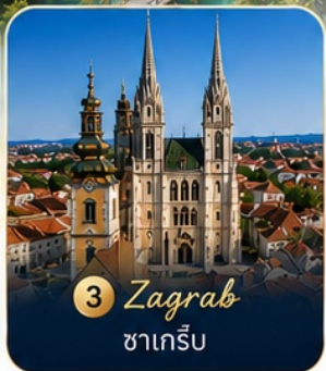
3 Zagreb ซาเกร็บ