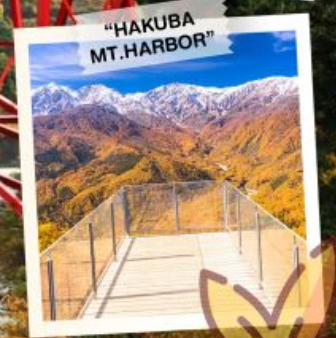
"HAKUBA MT. HARBOR"

วันเดินทาง 28 ต.ค. - 3 พ.ย. 2569 4 - 10 , 11 - 17 พ.ย. 2569