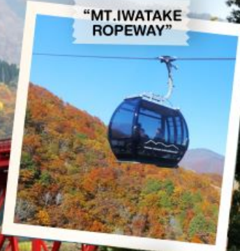
"MT. IWATAKE ROPEWAY"