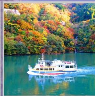
"SHOGAWA YURAN CRUISE"