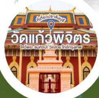
วัดแก้วพิจิตร