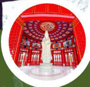
อู่ทองเกียรติ

แก่งหินเพ็ง KEANG HIN POENG อุทยานแห่งชาติเขาใหญ่