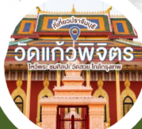
วัดแก้วพิจิตร