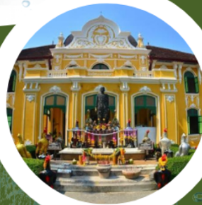
สวนสมุนไพร อภัยภูเบศร