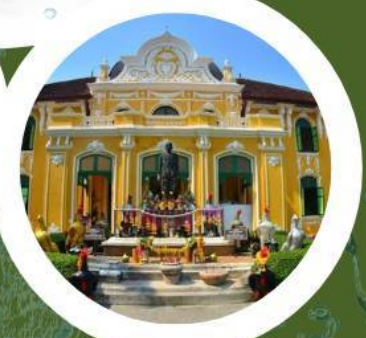
สวนสมุนไพร อภัยภูเบศร