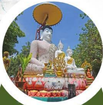
วัดรัตนเนตตาราม