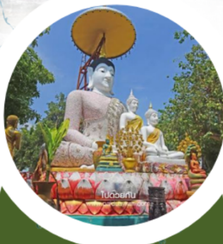
วัดรัตนเนตตาราม