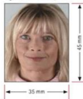
รูปถ่ายมาตรฐาน

3. สำเนาทะเบียนบ้าน/บัตรประชาชน หรือ สำเนาใบเปลี่ยนชื่อ-สกุล (ถ้าเคยเปลี่ยน)