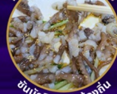
ซันนิกิจ อาหารท้องถิ่น