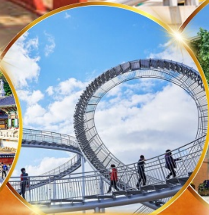
โพฮังสเปซวอล์ค