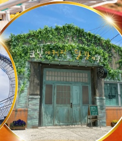
ตามรอยซีรีส์ดัง Hometown chachaCha

โพฮังสเปซวอล์ค สกายวอร์ค ตามรอยซีรีส์ Hometown chachaCha ถ่ายรูปชิคๆ หมู่บ้านวัฒนธรรมคิมซอน ขึ้นเคเบิลคาร์ ชมทะเลปูซาน นั่งรถไฟปูคปิก sky capsule ชิมของอร่อยตลาดแฮอนแด แหล่งช้อปปิ้งใต้ดิน ชัมยอน อิสระช้อปปิ้ง Lotte Duty Free