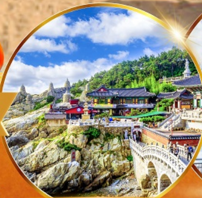
วัดแฮดงยงกุงซา