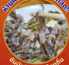
ชั้นนักชี อาหารท้องถิ่น