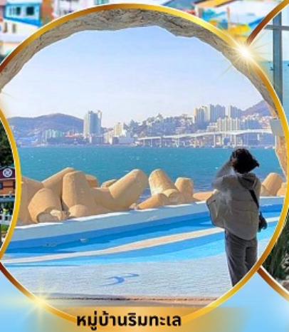
หมู่บ้านริมทะเล