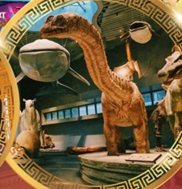
พิพิธภัณฑ์ธรรมชาติเซี่ยงไฮ้