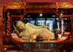
สักการะวัดพระหยกขาว