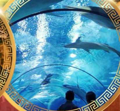
เซี่ยงไฮ้อาเซียนอะควาเรียม