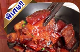
เมนูหมูสามชั้นตุ๋นน้ำแดง

พักโรงแรม 4 ดาว ★★★★★ ฟรี ประกันอุบัติเหตุ บริการ อาหารท้องถิ่น