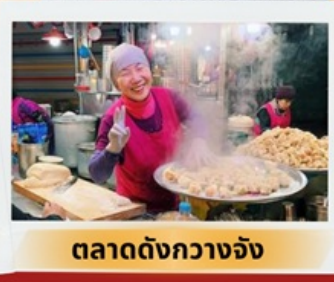
ตลาดดังกวางจ้ง