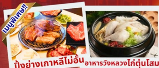
ปิ้งย่างเกาหลีไม่อื่น อาหารวังหลวงไก่ตุ๋นโสม