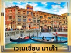
เวเนเซีย มาเก๊า