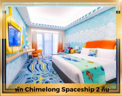
พัก Chimelong Spaceship 2 คืน