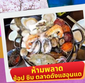
ห้ามพลาด ชื้อป ซิม ตลาดดังแฮอุนแด