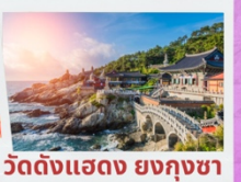
บั้งย่างเกาหลีไม่อั้น วัดดังแฮดง ยงกุงซา