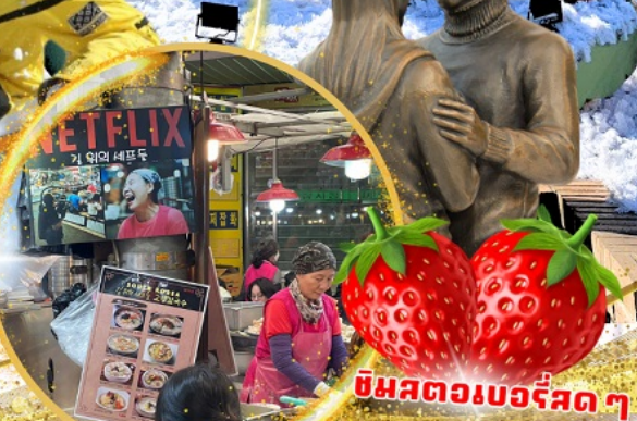
ตลาดกวางจง