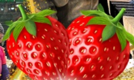
มีผลตอบเบอจึ่สด ๆ จากรั้ว