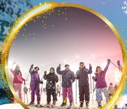
เล่นสกีสุดมันส์