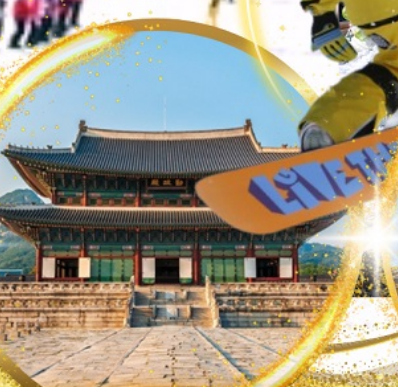
พระราชวังเคียงบกกุง