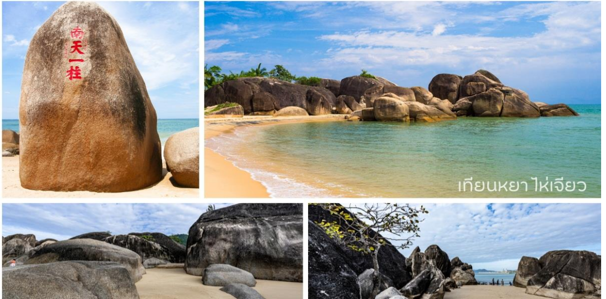
เทียนหย่าไห่เจียว