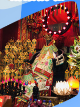
เจ้าแม่กวนอิมขี้เงิน