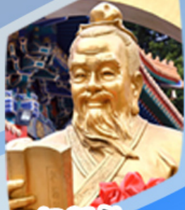
หลวงดำเขิน