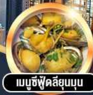
เมนูซีฟู้ดลิ้นจี่อบ