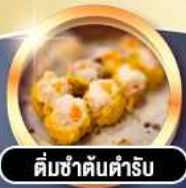
ต้มซ่าต้นตำรับ

гаринди! พักหรู 4 ดาว THE KOWLOON HOTEL ติดถนนนาธาน ย่านช้อปปิ้งจิมซาจอย