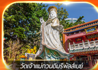
วัดเจ้าแม่กวนอิมทิฟลีย์

รวมตั๋วดิสนีย์แลนด์+รถรับ-ส่ง ซอปปิงแบบจัดเต็ม พักย่านจิมซาจุ่ย