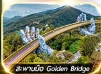
สะพานมือ Golden Bridge