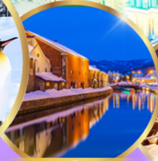
คลองโอตารุ