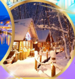
หมู่บ้านเทพนิยาย นิงเกิลเทอเรส

เดินทาง 01 - 06 กุมภาพันธ์ 68 02 - 07 กุมภาพันธ์ 68