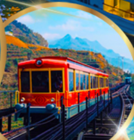
รถราง ซาปา