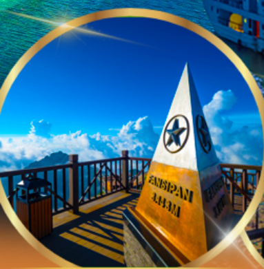
ยอดเขาฟานซีปัน

พักโรงแรม ★★★★★ GRAND SILK PATH SAPA HOTEL 2 คืน ROYAL CASINO HALONG HOTEL 1 คืน