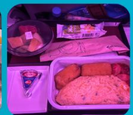
บริการอาหารร้อน ทั้งขาไป และ ขากลับ