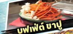
บุฟเฟต์ ซาบู