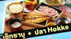
เซ็ทซาบู + ปลา Hokke