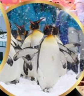
สวนสัตว์ อาซาฮิยาม่า