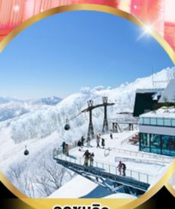
จุดชมวิว Unkai Terrace