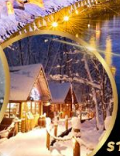
หมู่บ้านเทพนิยาย นิงเกิลเทอเรส