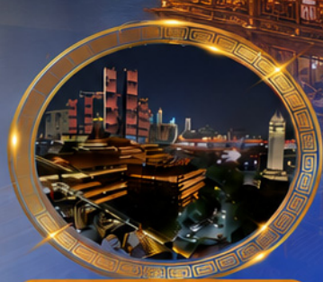
มีค้ำร้านอาหารวิวหลักล้าน ชมแสงสีเมืองลองซิ่ง