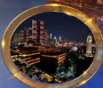
มือค่ำร้านอาหารวิวหลักล้าน ชมแสงสีเมืองลงชิง