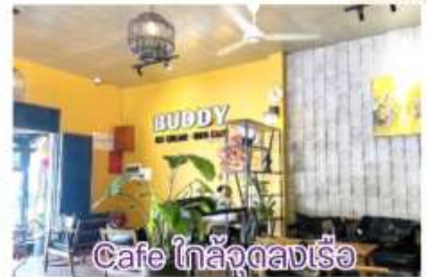
Cafe ไกล่จูดลงเรือ