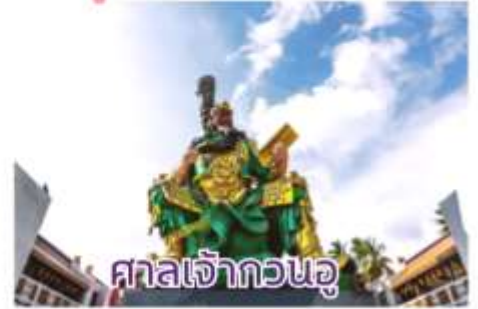
ศาลเจ้ากวนอู