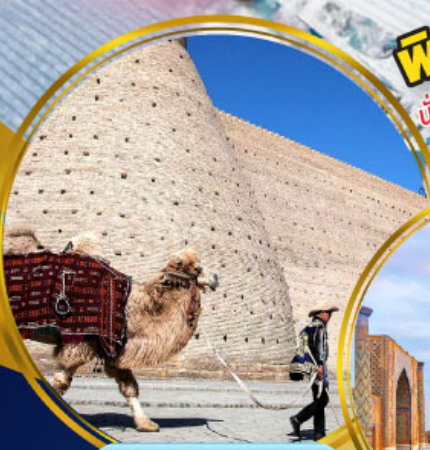
บ้อมปราสาทบุคาร่า