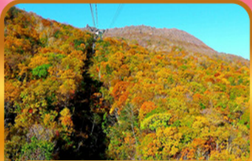
นั่งกระเช้าอุซุซัง