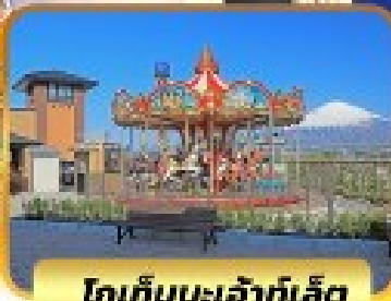
โทเก็มบะเจ้าที่เลิศ