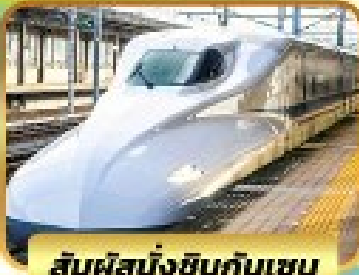
สัมผัสนั่งชินกันเซน