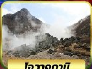
ไอวาคุดานิ