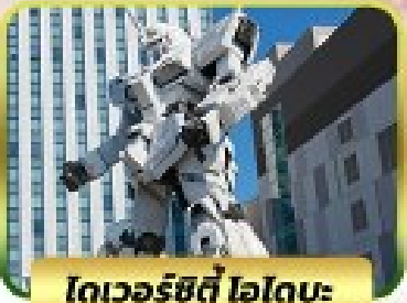
โตเวอร์ซิตี ไอโดบะ

*รวมเข้า ดิสนีย์ซี TOKYO DISNEY SEA 18-23 มิ.ย., 02-07 ก.ค. 24 16-21 ก.ค., 30 ก.ค. - 04 ส.ค. 24