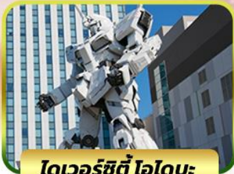
โตเวอร์ซิตี ไอโดเมะ