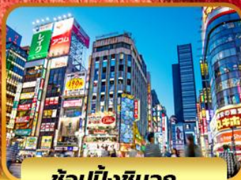
ช้อปบั้งชินจูกุ