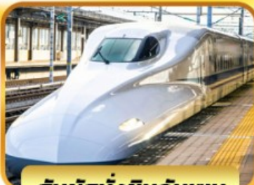
สัมผัสนั่งชินกันเซน