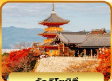
วัดคิโยมิสึ