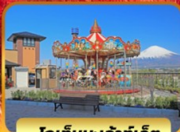
โกเท็มบะเจ้าท์เล็ท