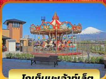
โทเก็บบะเอ๊าท์เล็ต