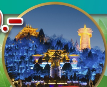
เมืองโบราณแซงกรีล่า