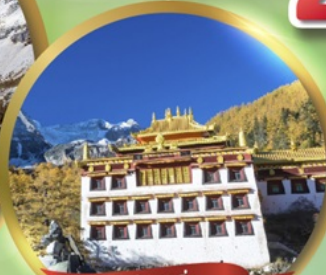
วัดชงกู่ CHONG GU