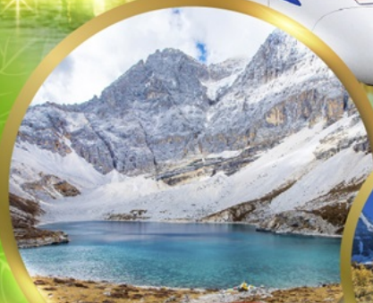
ทะเลสาบน้ำนม MILK LAKE