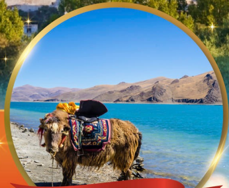
ทะเลสาบยัมดรก

"ทิเบต" เมืองมหัศจรรย์หลังคาโลก พระราชวังฤดูหนาวโปตาลา วิวสุดอลังการคาโนลาคลาเซียร์ อันซีนทะเลสาบศักดิ์สิทธิ์ "ทะเลสาบยัมดรก" พระราชวังโนร์บูลิงกา • วัดต้าเจา วัดที่ศักดิ์สิทธิ์ที่สุดในทิเบต • ตลาดบาคอร์