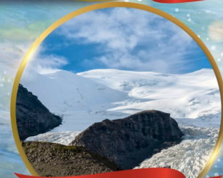
ธารน้ำแข็งคาโนลาคา