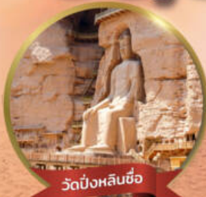
วัดปิ่งหลินซื่อ